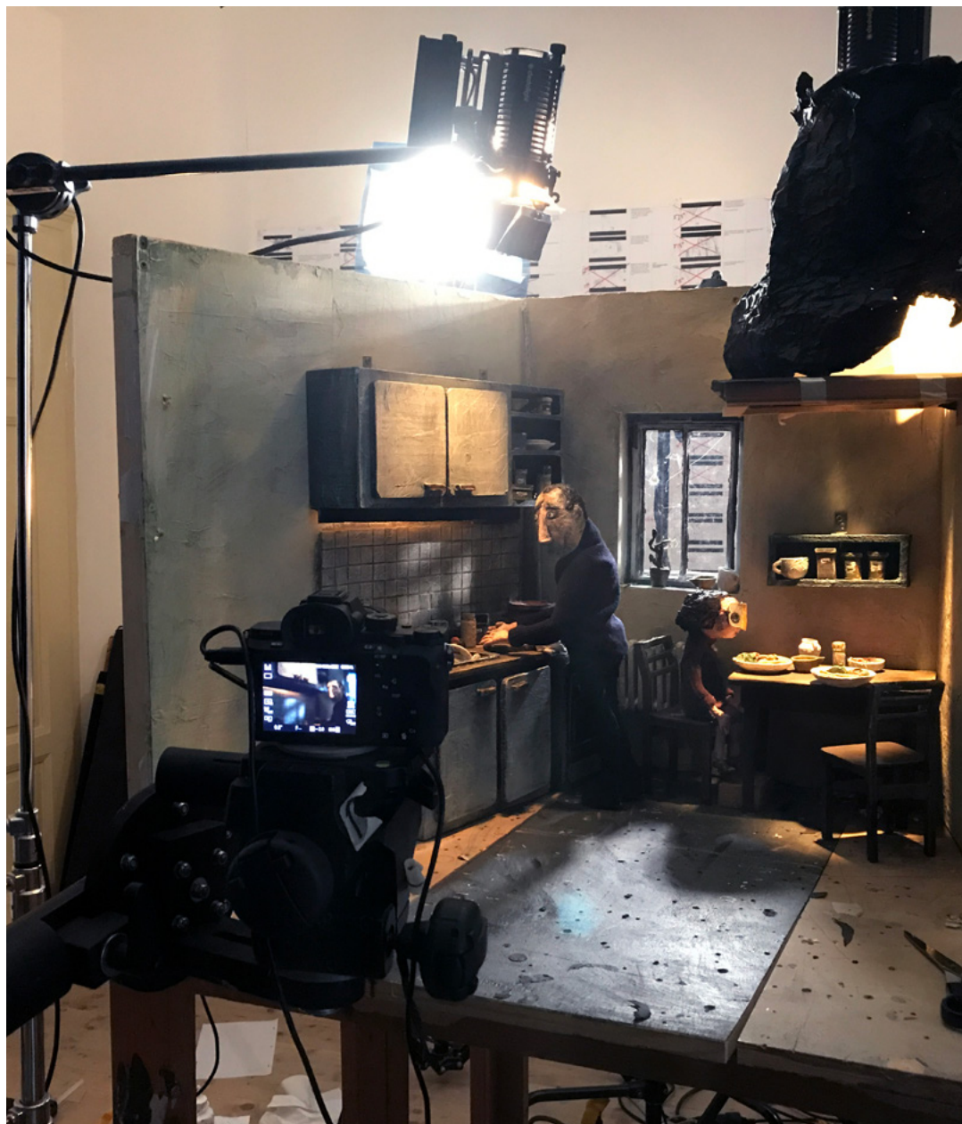
Z natáčení filmu Dcera