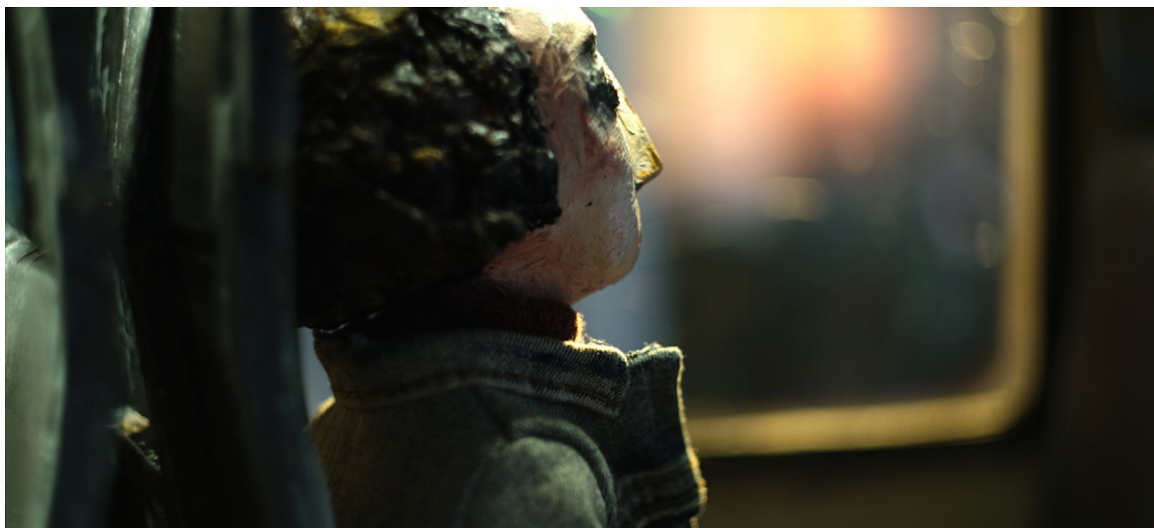
Záběr z filmu Dcera

Četla jsem, že jsou různé stupně závislosti a nezávislosti lidí. První je, když je člověk závislý na rodičích, pak učitelích a podobně. Druhý, když se osamostatní a funguje nezávisle a hledá svou cestu. A třetí, který přinese